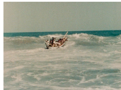
Mammy Water Jean Rouch Francia / Ghana, 1953 19 min Sonido, color, 35 mm

Unas horas antes de pasar por el quirófano, Stan Brakhage bajó a Boulder Creek para filmar el arroyo con la sensación desesperada de que tal vez fuese su última película. Las hermosas imágenes del río se intercalan con algunos fragmentos de película pintados a mano de color azul, como si el celuloide fuera la propia superficie del arroyo. Los destellos y las burbujas se han interpretado como la dimensión espiritual de la vida humana.