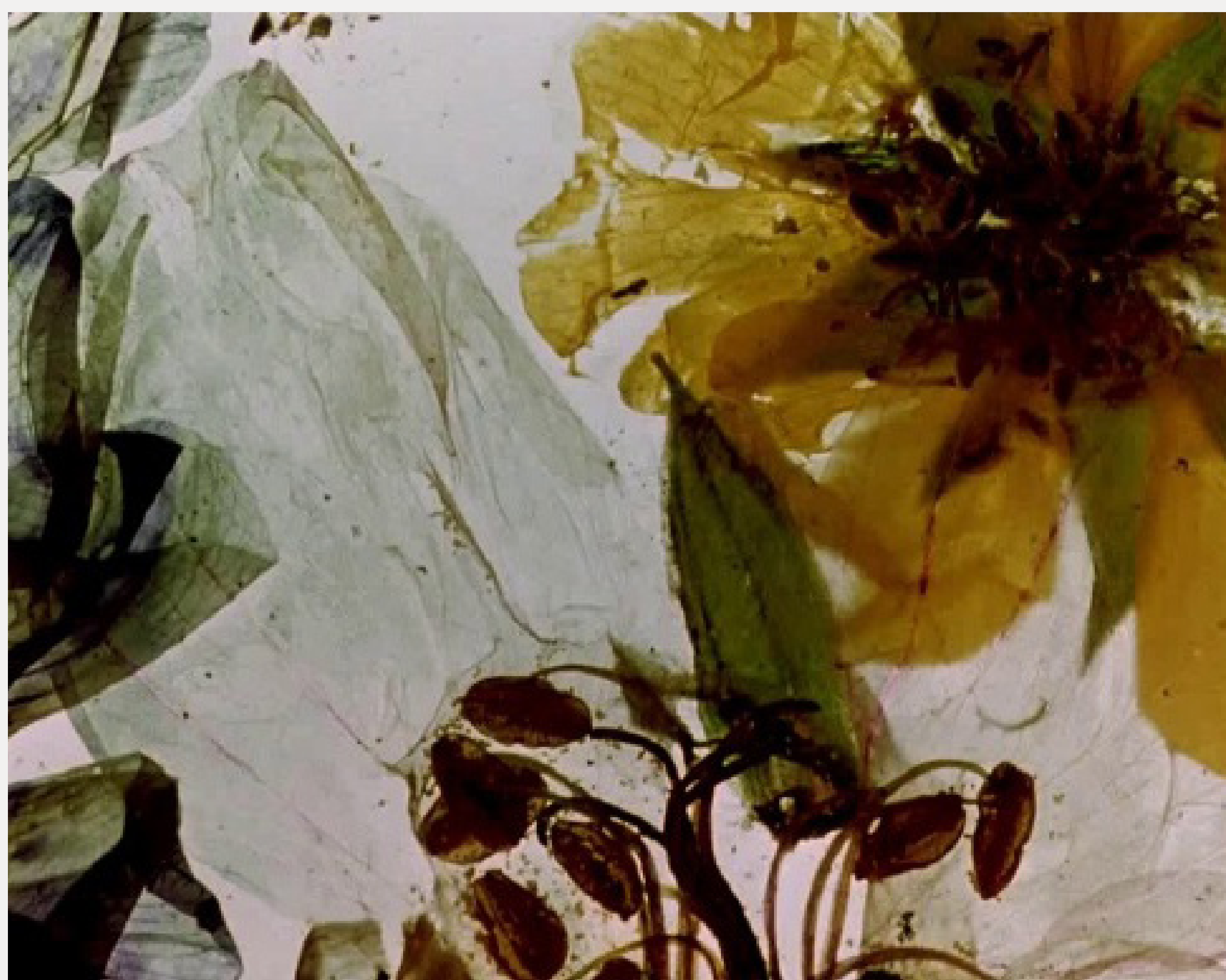
The garden of Earthly Delights , Stan Brakhage, 1981, 1 min 35 seg, digital from 35mm, film, silente (18fps).

Collage de hierbas, pétalos y hojas pegados directamente sobre película virgen. Un homenaje al Bosco, a la pintura “The Tangled Garden” de J.E.H. MacDonald, y a las flores de Emil Nolde. (Proyectada con permiso de los herederos de Stan Brakhage / Estate of Stan Brakhage)