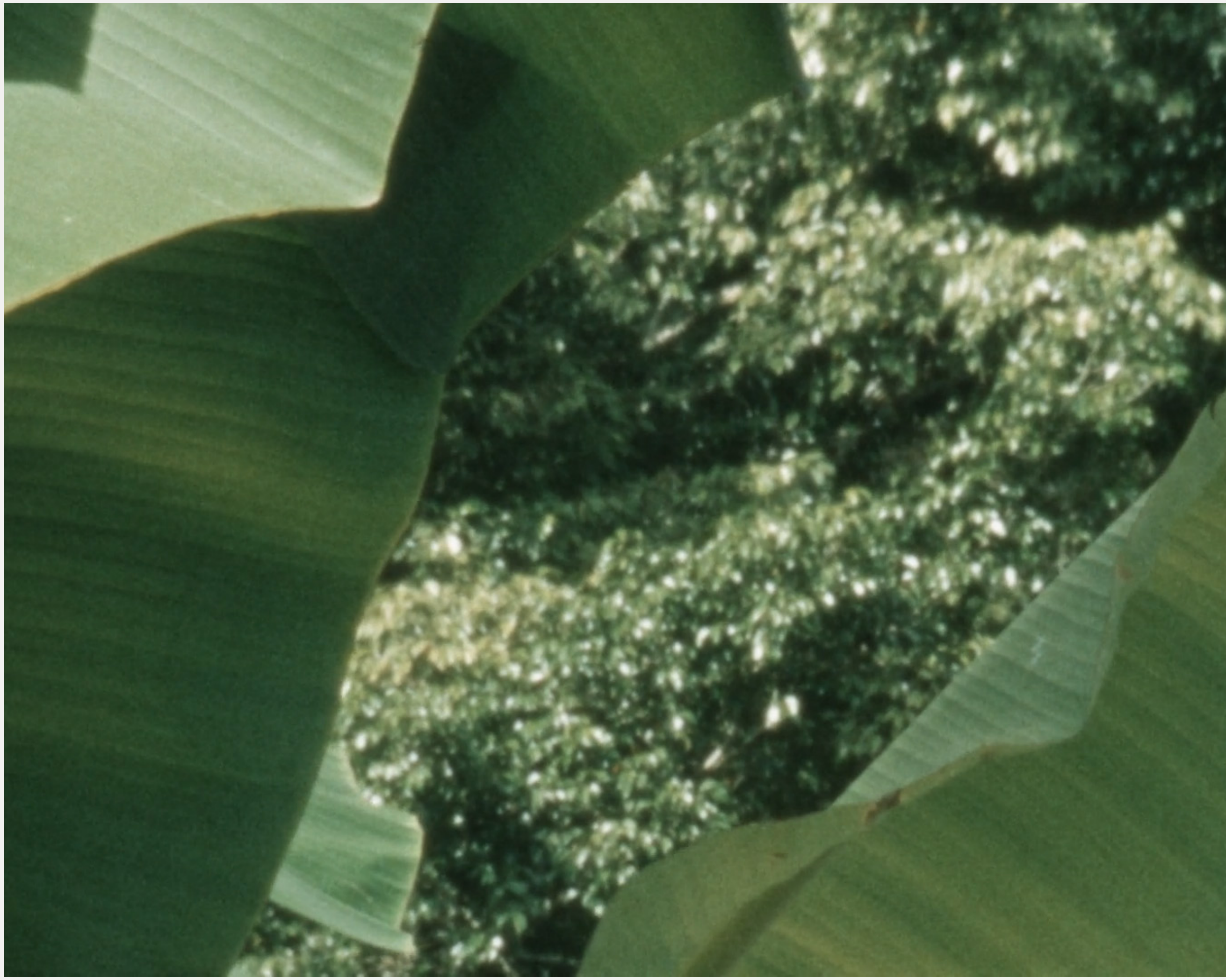
Untitled (Caribbean Garden) , Nick Collins, 2019, 2 min 45 seg, 16mm, Súper 8

Plataneros y otras grandes hojas de un jardín tropical.