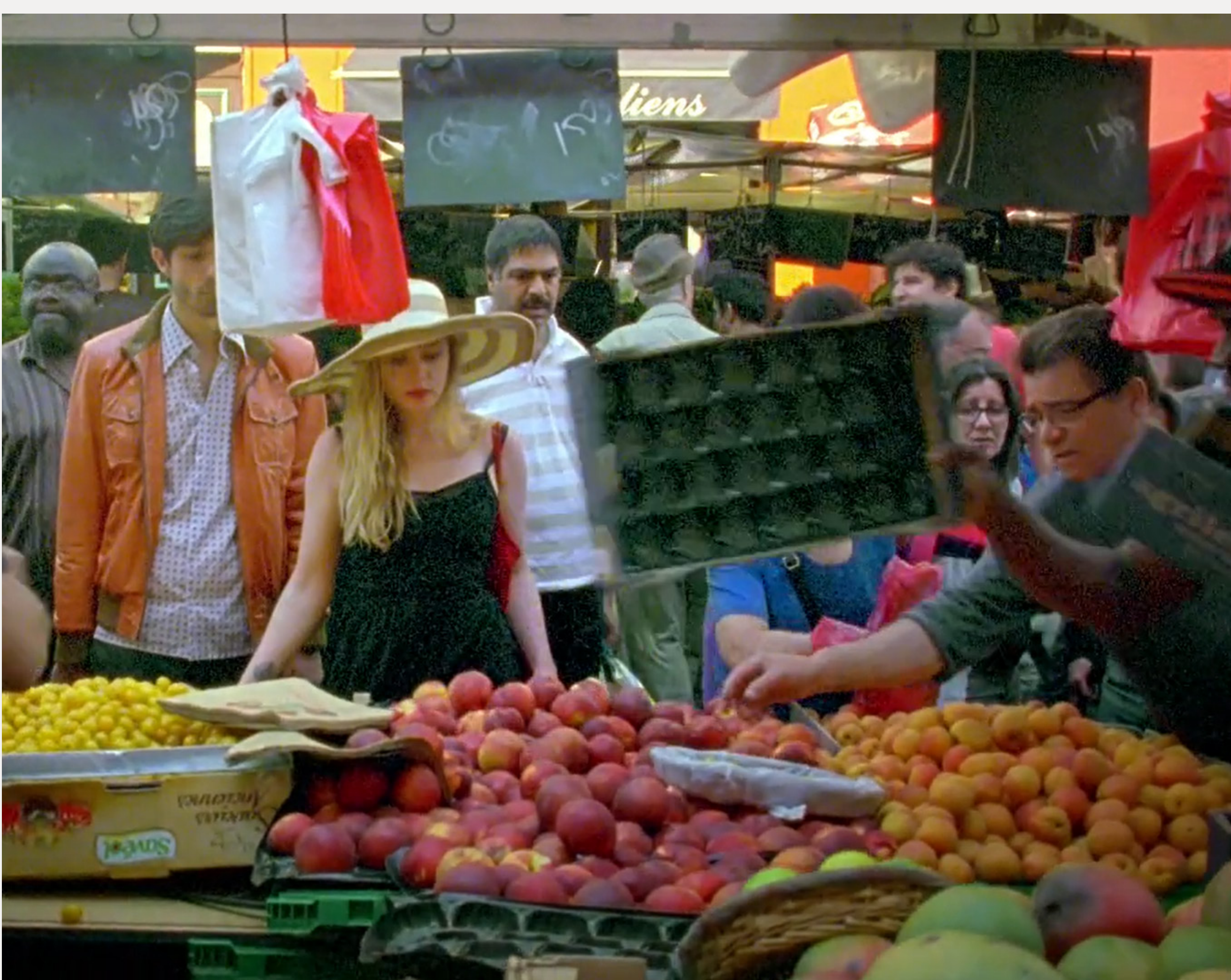
Le marché d'Aligre, Arne Körner, 2018, 8 min, 16mm

Uno de los grandes clásicos del cine de vanguardia. Un eclipse entre la visión y la ilusión.