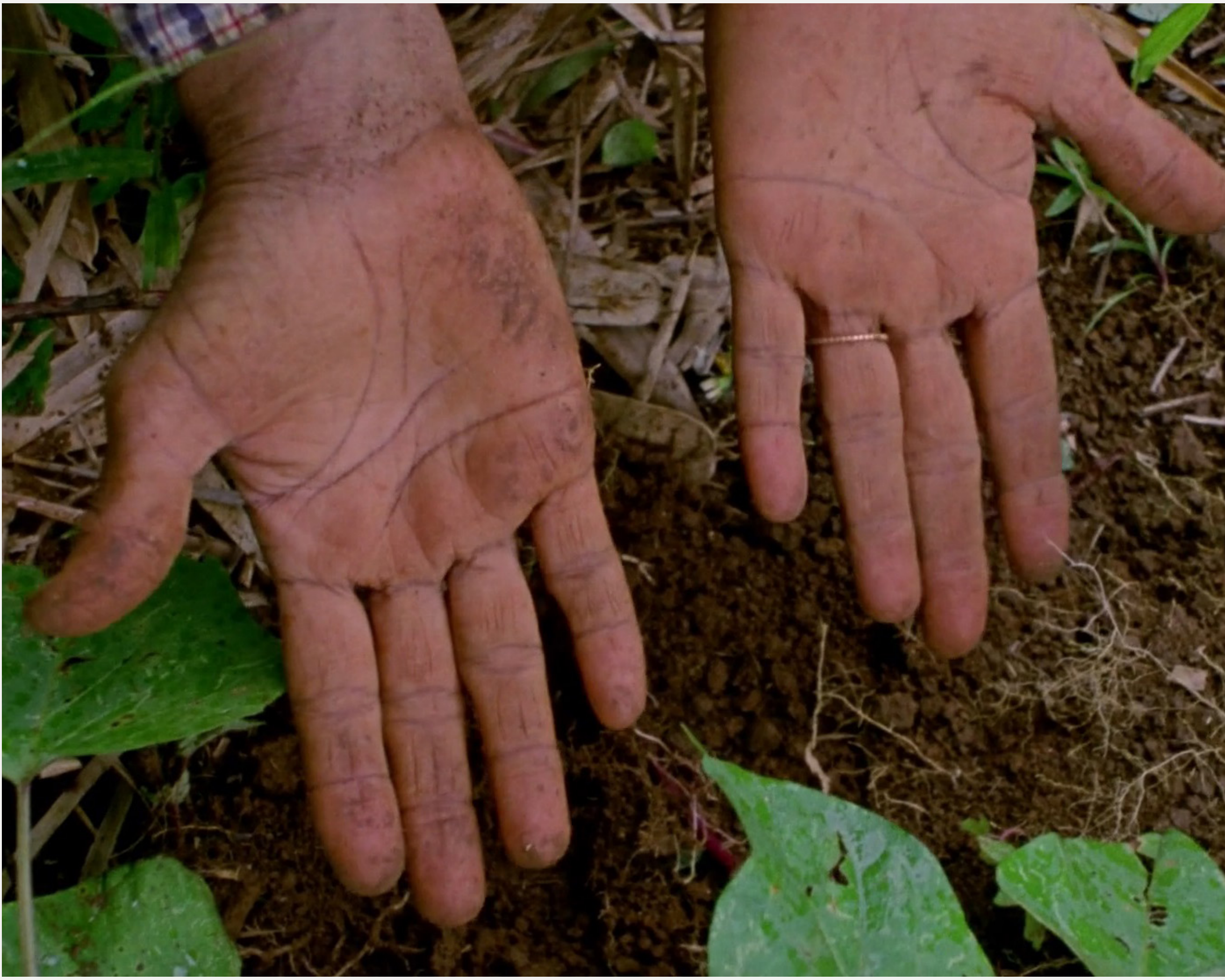
Le Jardin, Frédérique Ménant, 2019, 15 min, 50 seg, 16mm

Thérèse cultiva un jardín criollo en Guadalupe. Resiste los venenos invisibles. Sus manos se funden con la tierra. Su cara con la luz.