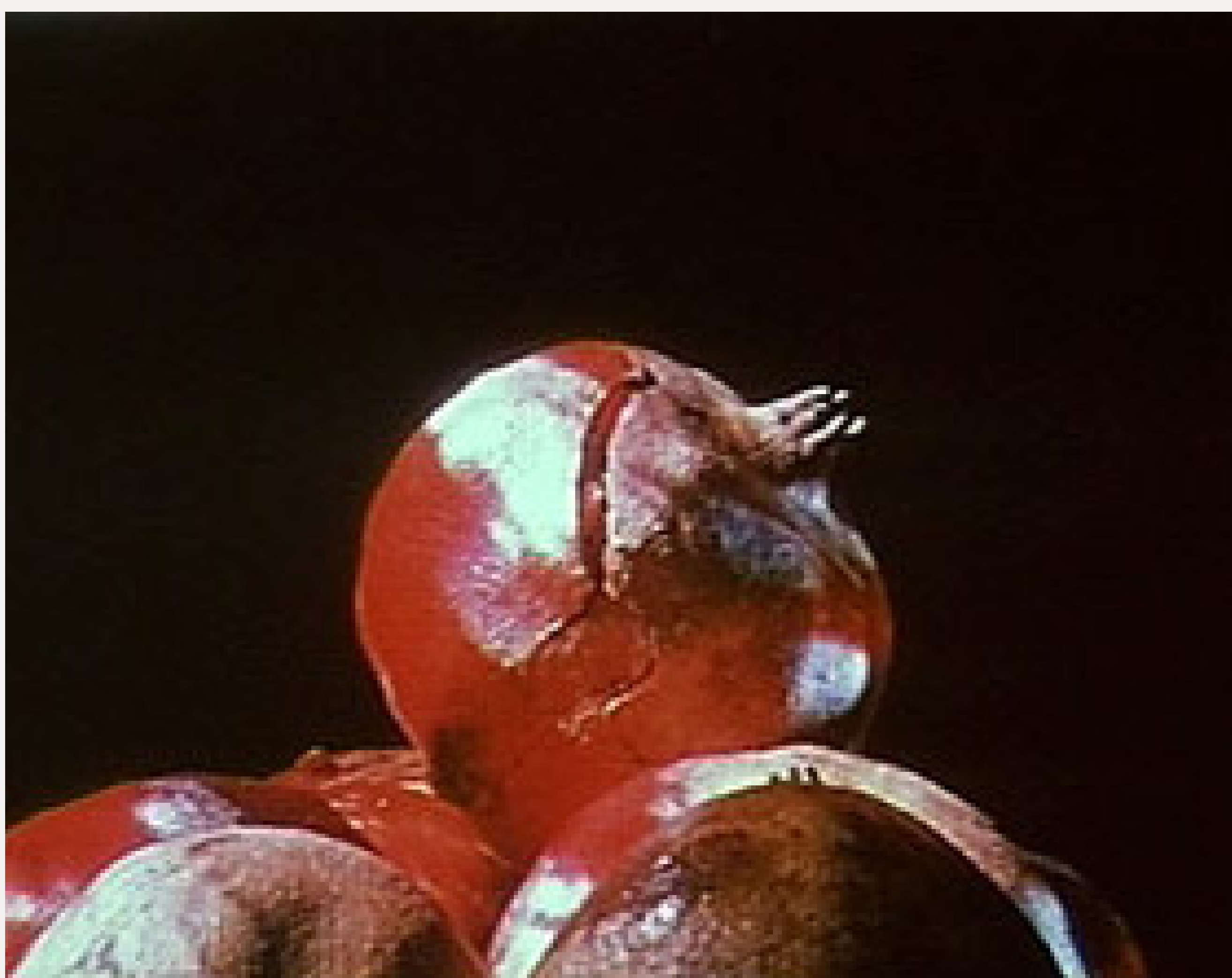
Variaciones sobre una granada , José Val del Omar, 1975, 3 min, 35mm, silente (Colección Inelcom Arte Contemporáneo. Madrid)

Una pareja de amantes pasea por la mezquita de Ispahan, donde los mosaicos y las miniaturas persas de jardines y plantas, esconden mensajes llenos de erotismo.