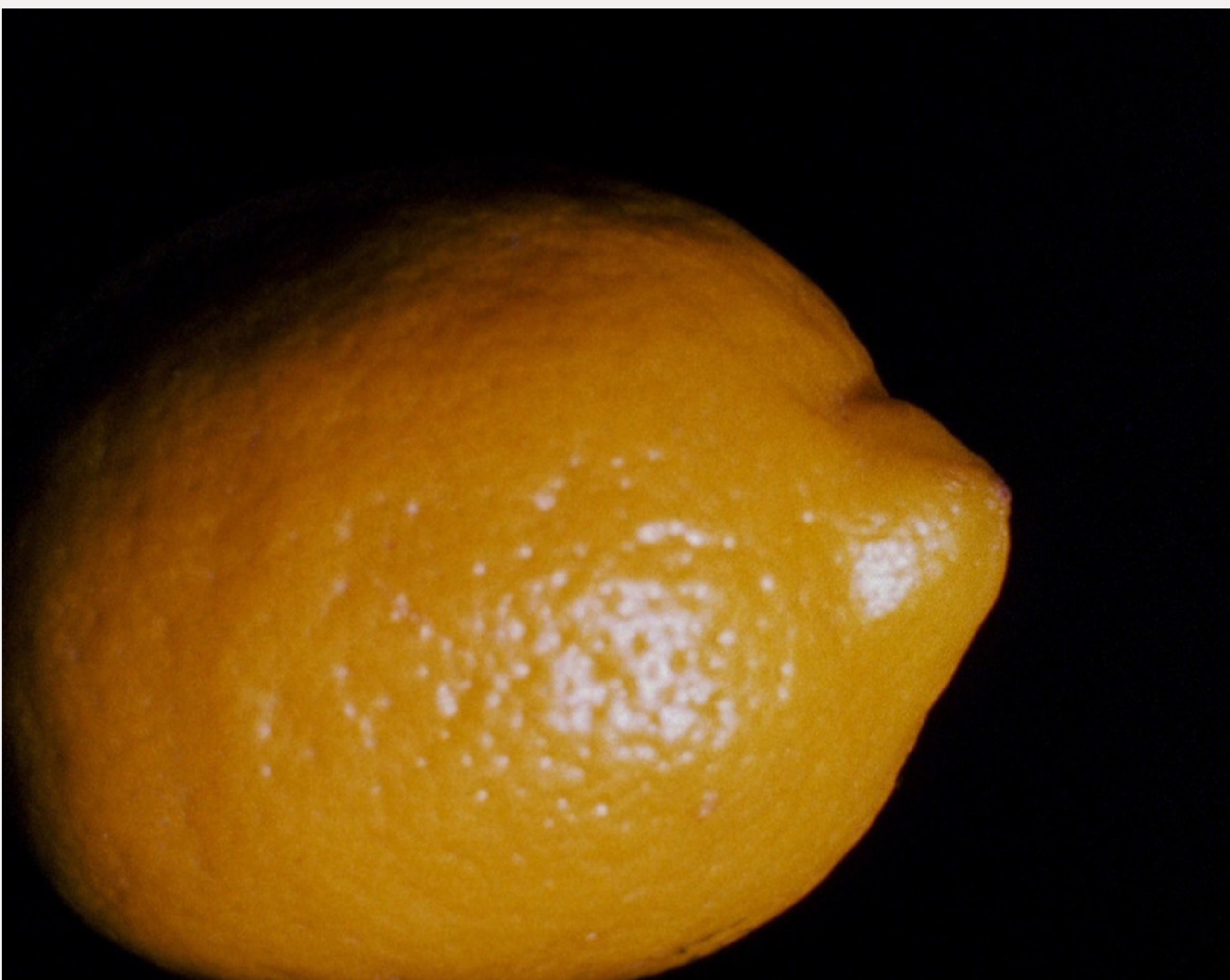
Lemon, Hollis Frampton, 1969, 7 min, 16mm, silente

Thérèse cultiva un jardín criollo en Guadalupe. Resiste los venenos invisibles. Sus manos se funden con la tierra. Su cara con la luz.