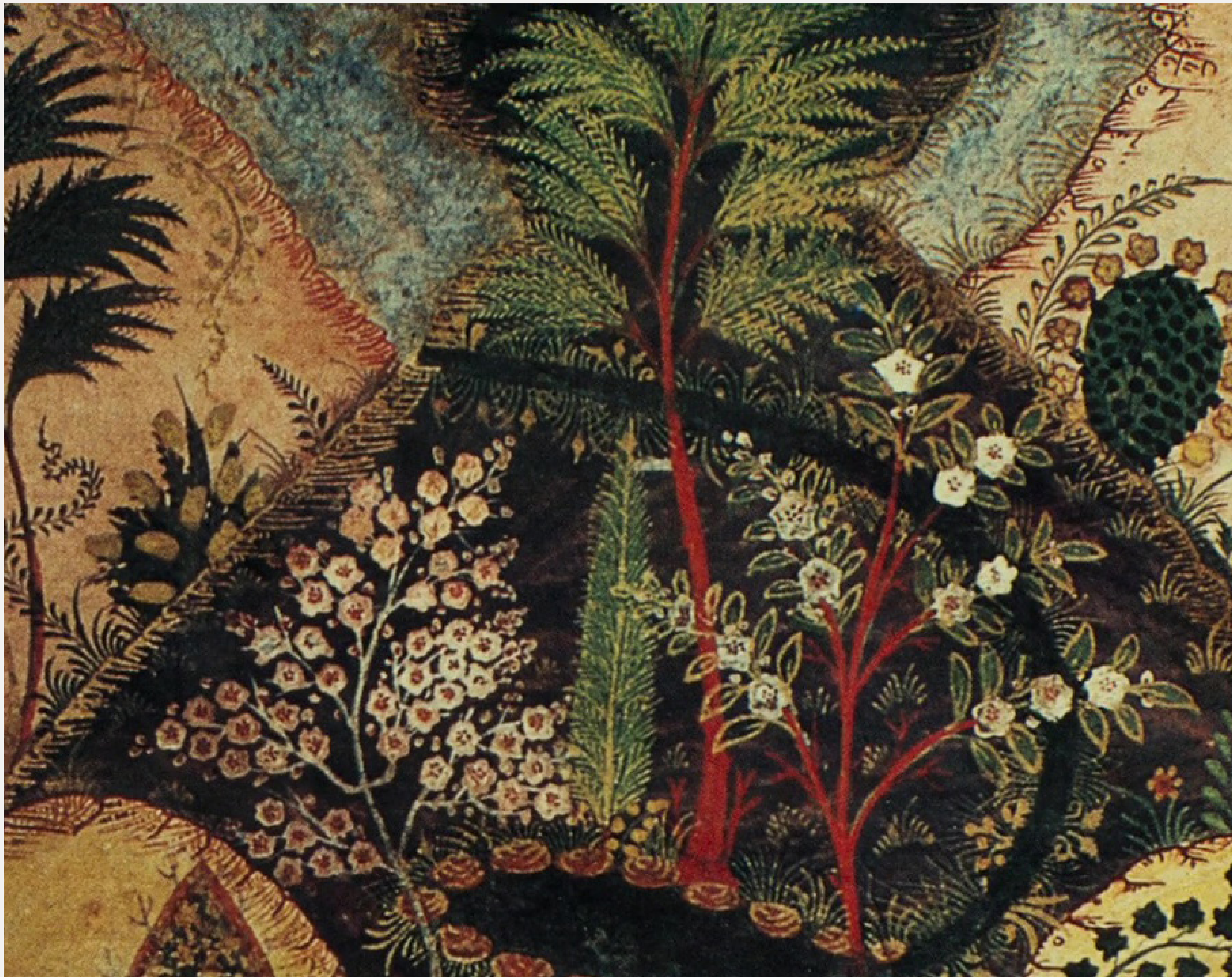
Plaisir d'amour en Iran , Agnès Varda, 1976, 6 min, 35mm

Plataneros y otras grandes hojas de un jardín tropical.